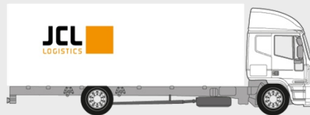
LKW 15to Plane oder Koffer : Palettenstellplätze: 17 Nutzlast: 7.000 kg