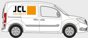
PKW / Kombi: Palettenstellplätze: 1 Nutzlast: 250 kg