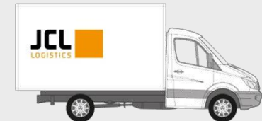
Transporter 3,5to - Plane: Palettenstellplätze: 7 Nutzlast: 1.000 kg