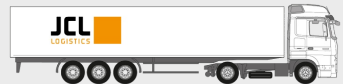
Sattelzüge: Palettenstellplätze: 34 Nutzlast: 24.000 kg