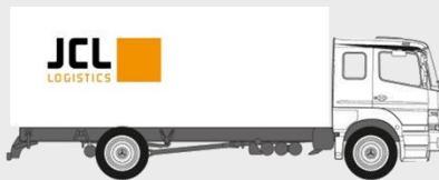
LKW 7,5to Plane oder Koffer : Palettenstellplätze: 15 Nutzlast: 2.200 kg